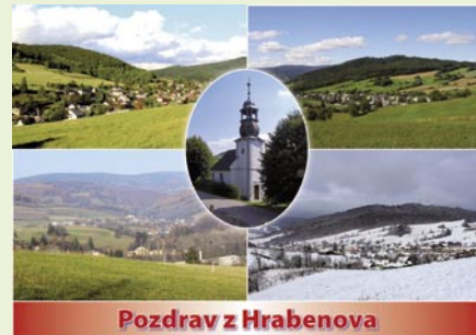
Pozdrav z Hrabenova

TJ Sokol Hrabenov připravila vydání dvou různých pohlednic, z nichž jedna ilustruje činnost TJ a druhá zachycuje Hrabenov a okolí. Autorem některých použitých fotografií je Josef Ptáček nejmladší, ostatní jsou z archivu TJ Sokol. Můžete si je zakoupit u Kleinů, Tymelů a Wittmannů. Cena jedné pohlednice je 5,- Kč.