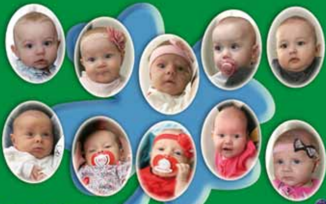
Vítání občánek - Ruda nad Moravou 26.3. 2018