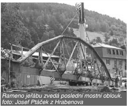
Rameno jeřábu zvedá poslední mostní oblouk.