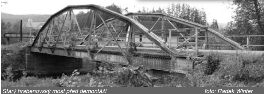
Starý hrabenovský most před demontáží