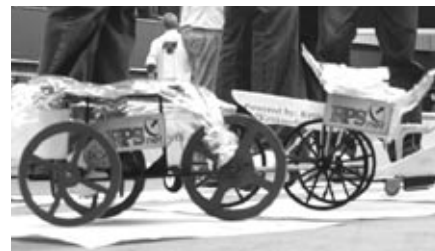
Na fotodokumentaci vozidel naší školní reprezentace je vidět, že firemní logo sponzora RPS Olšany je součástí designu - jak je zvykem u pořádných závodních strojů.